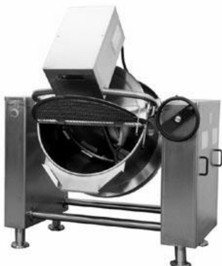
Bassine de cuisson Auriol

C'est le moyen le plus simple et le plus rapide pour la cuisson de grandes quantités d'aliments, même avec un haut degré d'acidité. Dans les versions indirectes, le système avec séparation empêche que les produits puissent rester collés au fond du récipient. En utilisant des cages appropriées on peut pasteuriser des pots de confitures et de sauces.